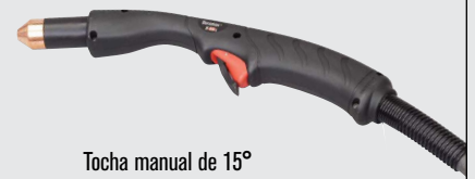
Tocha manual de 15°