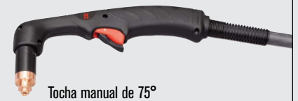
Tocha manual de 75°

(para mais opções de tochas, visite www.hypertherm.com )