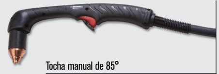
Tocha manual de 85°

Estilos de tocha padrão Duramax® Hyamp™ (para mais opções de tochas, visite www.hypertherm.com )