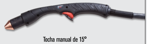
Tocha manual de 15°